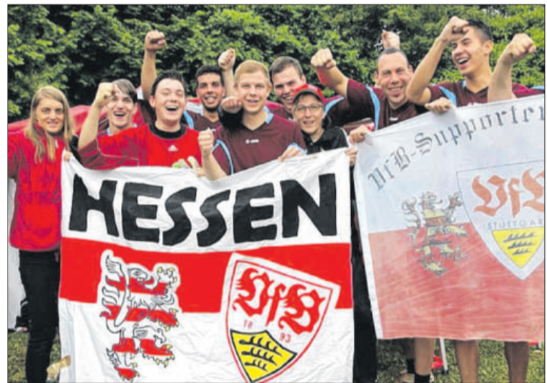
23 VfB-Fan-Teams aus ganz Süddeutschland haben in Arnegg ihre 21. Meisterschaft ausgetragen. Der Spaß kam dabei nicht zu kurz.

Höhepunkt für viele war ein Einlagepiel am Sonntagnachmittag: Ein Team mit Spielern der Blautal-Stürmer und des SV Arnegg trat gegen die Traditionsmannschaft des VfB Stuttgart an. „Es ist schon eine Ehre, gegen Legenden wie Guido Buchwald oder Silvio Meißner zu spielen“, freute sich Blautal-Präsident Löw.